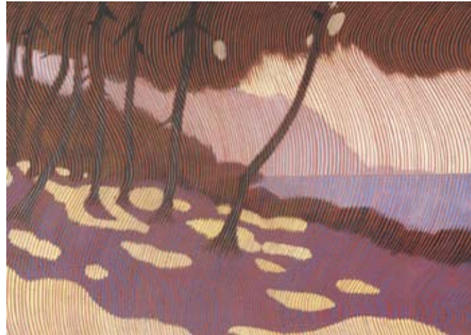
Sexto Canegallo, Mezzogiorno (Midday) , 1920

In the imagination of the 20th century Ligurian poets, the Liguria region, Scarsa lingua di terra che orla il mare “Scant tongue of land bordering the sea” (Sbarbaro), with its brightness and its harshness, has become the emblematic landscape of the contemporary soul. The intention of this exhibition is to show how, in the paintings of the same period, a “Ligurian” identity of painted images was also formed, and how it stemmed from the same inspiring nucleus from which the poetry came.