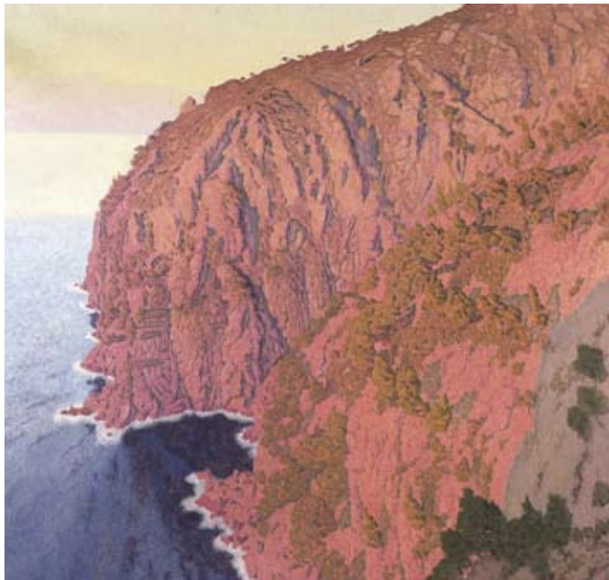
Domenico Guerello, Alba-Inverno (Sunrise-Winter) , 1926

dal quale nasce la poesia. Articolata tra la Sala Capitolare dell’Abbazia e la Torre dei Doria, la mostra presenta quarantotto dipinti di paesaggio, talora inediti, in un percorso che va dai maggiori pittori del primo novecento in Liguria, come Merello, Discovolo, Guerello, Canegallo, sino ai più significativi artisti degli anni trenta.