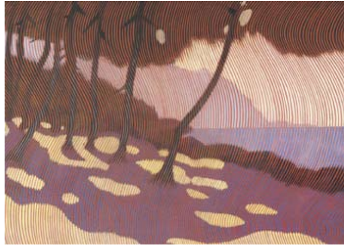
Sexto Canegallo, Mezzogiorno (Midday) , 1920

In the imagination of the 20th century Ligurian poets, the Liguria region, Scarsa lingua di terra che orla il mare “Scant tongue of land bordering the sea” (Sbarbaro), with its brightness and its harshness, has become the emblematic landscape of the contemporary soul. The intention of this exhibition is to show how, in the paintings of the same period, a “Ligurian” identity of painted images was also formed, and how it stemmed from the same inspiring nucleus from which the poetry came.