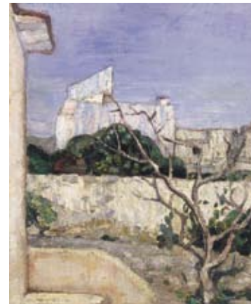
Eso Peluzzi, Casa a Varigotti (House in Varigotti) , 1925

Split up between the Chapter House of the Abbey and the Doria Tower, the exhibition comprises forty-eight landscape paintings, some of which hitherto unknown, in a path leading from the greatest early 20th Ligurian painters such as Merello, Discovolo, Guerello and Canegallo, up to the most significant artists of the nineteen-thirties.